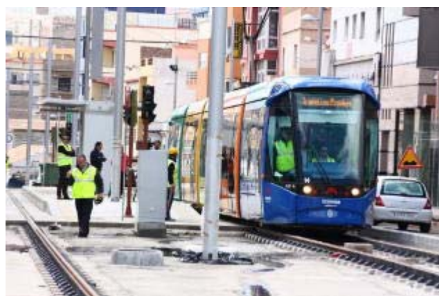
Hoy comenzarán las tareas de asfaltado en el margen derecho de la carretera La Cuesta-Taco. La opinión

LA OPINIÓN | SANTA CRUZ DE TENERIFE Ayer, por primera vez, el tranvía comenzaba a circular por la Línea 2, eso sí, en periodo de pruebas. Metropolitano "logró que el tranvía llegase a la parada Tíncer sorprendiendo a cuantos vecinos, conductores y peatones se cruzaban con la unidad". En esta ocasión, el citado vehículo ha recorrido los 1.200 metros que conforman este ramal (una parte de la Línea 2 de 3.800 metros), recorriendo la avenida de Taco, subiendo la calle Andrés Orozco Mafiotte hasta llegar a la parada de Tíncer. A continuación se realizaron varios recorridos en los dos sentidos de este ramal, regresando más tarde a Talleres y Cocheras. Los técnicos de Metropolitano indican que esta primera prueba ha sido satisfactoria. Este acontecimiento se une a la reciente llegada del segundo vehículo de los seis que se destinarán a esta línea.